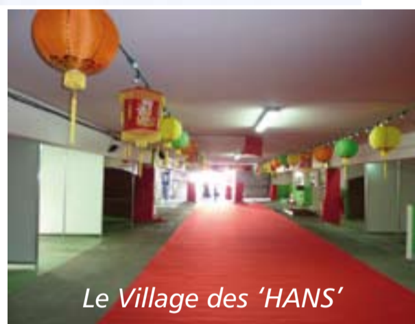
Le Village des 'HANS'

Si Guan Di ne peut être fêté à l'évidence sans les Temples, la commémoration de son anniversaire, dans le format 'grand public', ne peut se concevoir également sans le... Village des 'HANS'